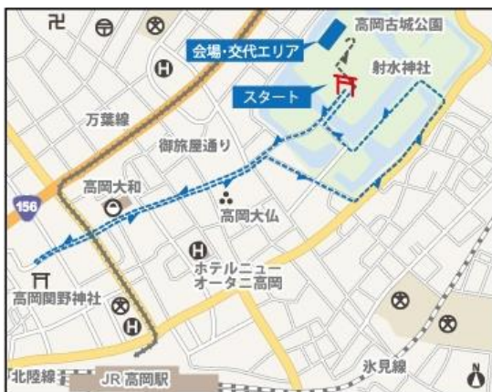
【個人ラン 1 周目 / 約 2.9km】