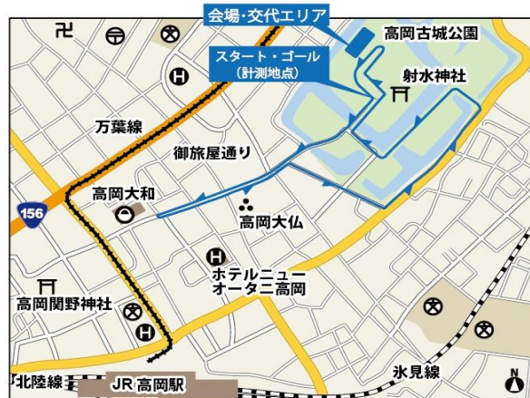
【個人ラン 2~4 周目 / 約 2.5km】